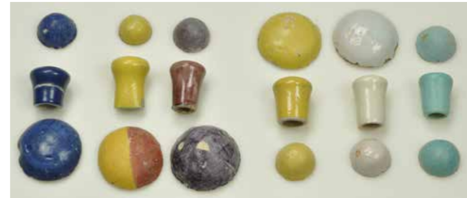
17 Plaatelbakkersproeven en knoppen, tinglazuur-aardewerk en porselein, Delft?, ca. 1750, privécollectie

Werden de porseleinen knoppen kant-en-klaar geleverd door andere porseleinproducenten of was er kaolien in de werkplaatsen aanwezig? En waarom verschillen de vormen zo sterk van elkaar? Het blijft dus vooralsnog onduidelijk of het gaat om eigen producten of om (B-keus)producten uit andere fabrieken, die in Delft zijn gebruikt voor het testen van nieuwe materialen of kleuren. Daarbij is de connectie tussen beide plaatelbakkerijen, waaruit hetzelfde vondstmateriaal afkomstig is, ook een interessant gegeven. Het is niet ondenkbaar dat Gerard den Appel, eigenaar van De Vergulde Boot , het productiemateriaal voor zijn eigen fabriek heeft verworven na de opheffing van Het Gecroond Porselein in 1753. Het materiaal van de verschillende stukken zal beter (chemisch) geanalyseerd moeten worden, waarbij ook een bredere vraagstel-